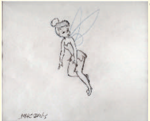
③ティンクの生みの親、ディズニーの伝説的クリエイター、マーク・デイビス氏によるドローイング / 1950年代