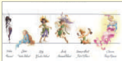
④ディビット・クリスチアナによる「ディズニー フェアリーズープリラの夢の種」挿絵原画 / デイビット・クリスチアナ作 ⑤妖精ベックのモデルシート ⑥妖精のサイズ・コンパゾン・シート